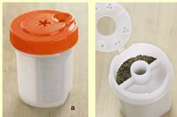
a Petite salière/poivrière réglable 20 mL / 0,8 oz 89452 Orange/blanc neige translucide 5,00 $ 2,50 $ de don

Tous les dons faits à la Fondation Tupperware Brands seront utilisés pour soutenir le programme «Prends C.E.L.A. à la légère!».