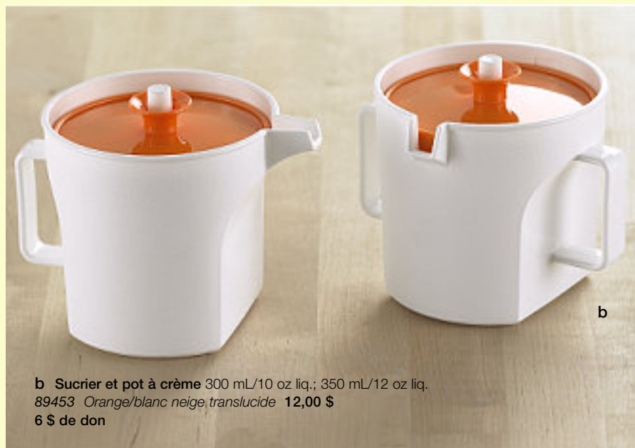
b Sucrier et pot à crème 300 mL/10 oz liq.; 350 mL/12 oz liq. 89453 Orange/blanc neige translucide 12,00 $ 6 $ de don

Arrondissez votre commande au dollar supérieur et nous remettrons la monnaie aux Clubs des garçons et filles du Canada – demandez les détails à votre Conseiller(e).